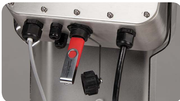
USB avec manchon de raccordement étanche en option