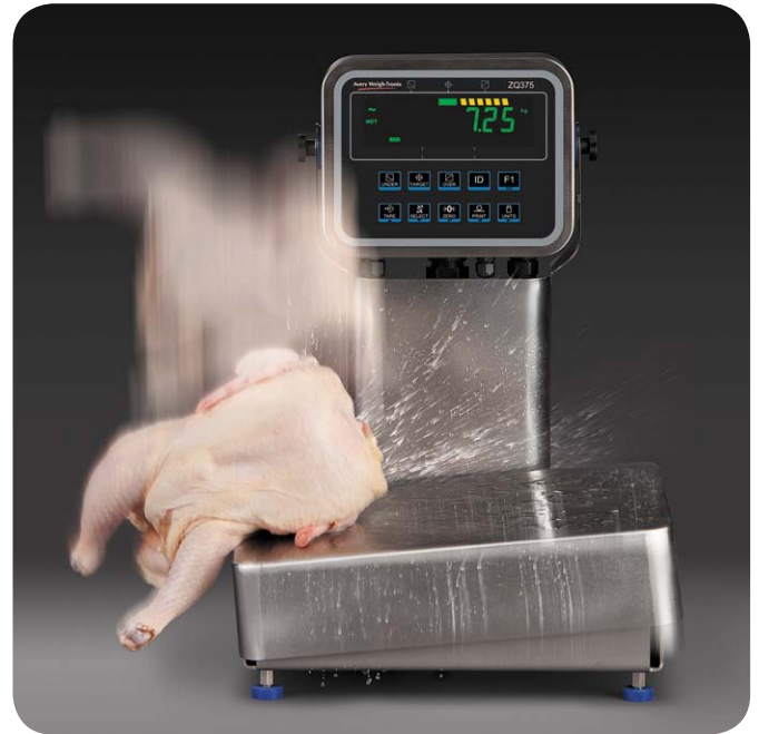
La Torsion Base offre une protection contre les charges accidentelles à hauteur de 500 %.

Capable de résister à des charges accidentelles jusqu'à un niveau de 500 %, notre système de transfert de charge de protection est le gage d'une précision et d'une fiabilité à toute épreuve. Cette base, à la technique éprouvée, évacue automatiquement les charges accidentelles et surcharges de la cellule de pesage vers la structure de la base, préservant ainsi la précision de la balance tout en garantissant ses performances. Contrairement à d'autres dispositifs visant à réduire l'impact des charges accidentelles, notre modèle en acier inoxydable conçu pour le contrôle de la qualité alimentaire, constitue une solution saine et simple, bénéficiant d'une certification NSF et résistant à des lavages intensifs.