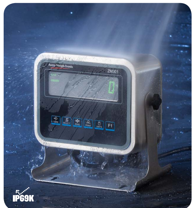
Nettoyage haute pression