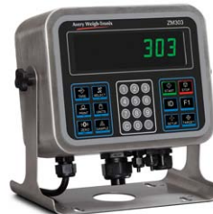
Boîtier en acier inoxydable Affichage IBN