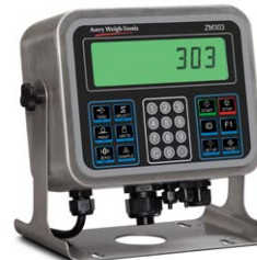
Boîtier en acier inoxydable Affichage TN