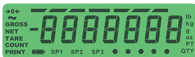
Affichage TN Idéal pour un usage en extérieur (ZM303 uniquement)