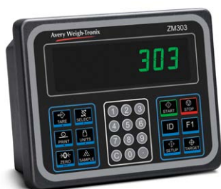
Boîtier en aluminium pour plan de travail

En plus de cette polyvalence en contextes variés, les modèles en acier brossé inoxydable 304 comprennent un socle pivotant permettant d'ajuster les angles de vue et de fixer l'appareil à un mur, un bureau ou un support.