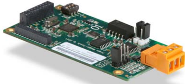
Carte de sortie analogique 0-10 V c.c. et 4-20 mA.