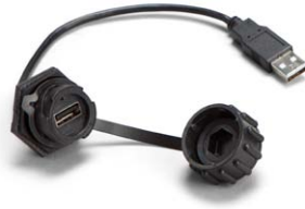
Manchon de raccordement étanche – USB