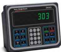
Boîtier en aluminium Affichage IBN