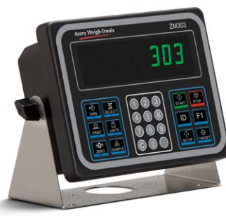
Kit pour plan de travail Pour les modèles de boîtiers en aluminium.