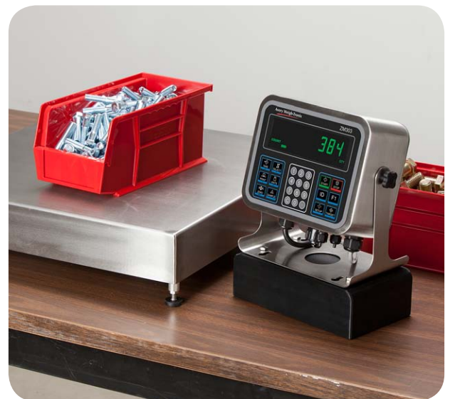
Application de comptage