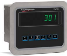
Dispositif en acier inoxydable à montage sur panneau Affichage IBN