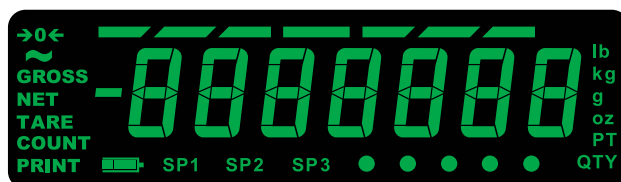
Affichage IBN Idéal pour un usage en intérieur

un rétroéclairage vert confortable pour les yeux, adapté aussi bien à un usage en plein soleil qu'à la tombée de la nuit ou en hiver, dès que la lumière naturelle décroît.