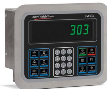
Boîtier en acier inoxydable à montage sur panneau