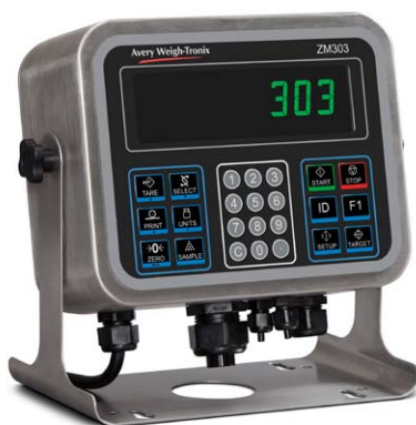
Boîtier en acier inoxydable IP69K