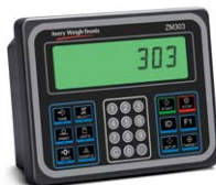
Boîtier en aluminium Affichage TN