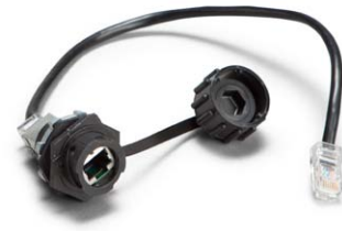
Manchon de raccordement étanche – Ethernet