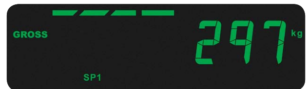
Affichage multi-segments pour les applications de pesée de vérification et de contrôle des processus

Les matériaux longue durée utilisés pour le clavier des appareils de la série ZM sont solides, stables et résistants aux produits chimiques ; ces appareils sont recouverts d'un régulateur rétroactif tactile en métal améliorant le confort d'utilisation.