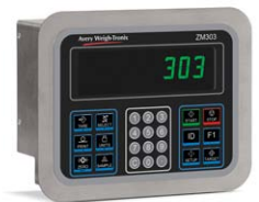
Dispositif en acier inoxydable à montage sur panneau Affichage IBN