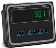
Boîtier en aluminium Affichage IBN