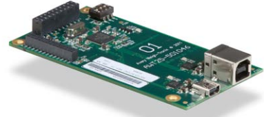
Carte de périphérique USB Assure une interface USB avec un ordinateur personnel.