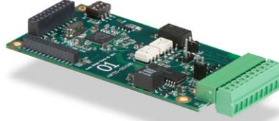
Carte de boucle de courant Boucle de courant/RS485/RS422.