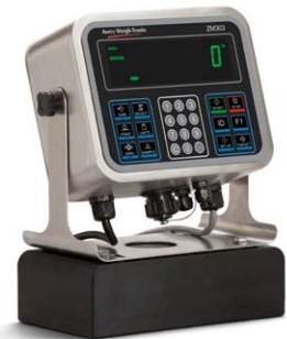
Bloc-batterie externe Bloc-batterie externe adaptable avec interrupteur marche/arrêt. Nécessite quatre batteries de type D d'une autonomie de 12 heures pour un système de capteur de poids unique, et d'une autonomie de 11 heures pour un système à quatre capteurs de poids.