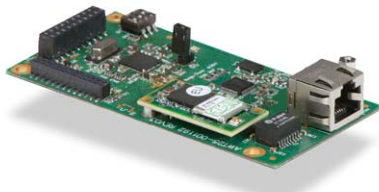
Carte interne sans fil 802.11b/g sans fil