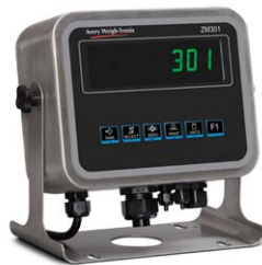
Boîtier en acier inoxydable Affichage IBN